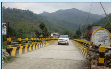
घाँटिछिना मोटेरेबल पुल