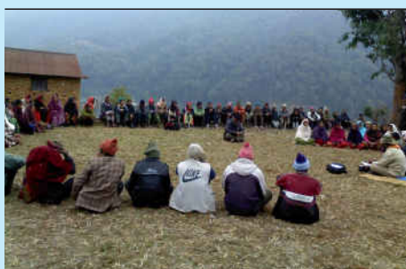
WCF बैठक थुम्की गाविस