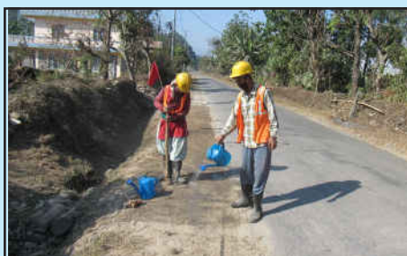
दोबिल्ला, बाघमारा सडक