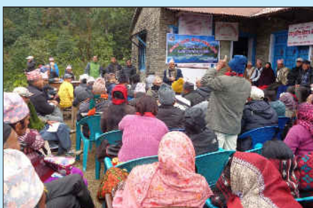
ईलाका स्तरीय योजना तर्जुमा गोष्ठी, धम्पुस