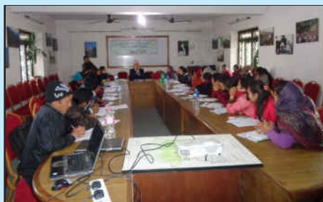
सामाजिक परिचालकहरूको छलफल